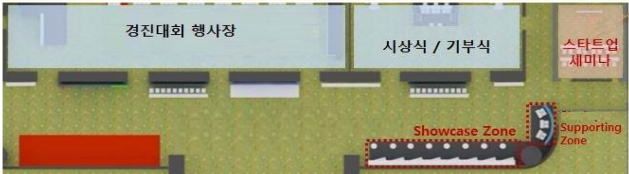
전체 행사장 구성