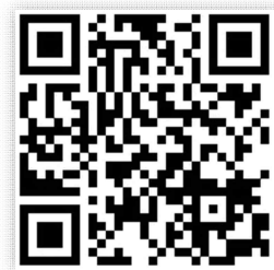
사업설명회 접속 QR