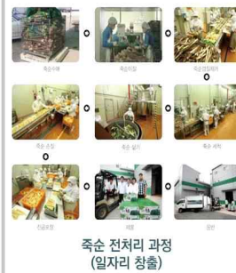
죽순 전처리 과정 (일자리 창출)